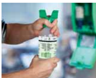
Forgassa el a kupakot a nyíl irányába, amíg a zár felszakad.