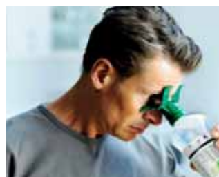
Ezután a szem úgy is öblíthető, ha enyhén előrehajol.