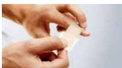
...és egy kézzel is könnyen felragasztható.