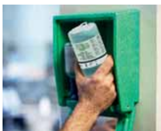
A Plum szemkimosó egyszerűen használható, ha szembaleset történik.

Termékeinket szakképzett szemspecialisták közreműködésével fejlesztettük ki. Ez azt jelenti, hogy szemöblítők kialakítása közben a legapróbb részletekre is gondoltunk. Piktogramokkal segítünk a helyes alkalmazásban. A kupak segít folyamatosan nyitva tartani a szemet öblítés közben. Az öblítés így megfelelő helyen éri a szemet, egyenletesen, optimális mennyiségben.