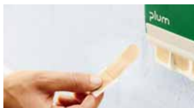
Vegye ki a tapaszt az adagolóból. Az rögtön használatra kész...

Kisebb balesetek minden nap történhetnek a munkahelyen is. Apró sérüléseknél elegendő egy ragtapasz is. Válassza ki az ön munkahelyének megfelelő tapaszt - vagy azok megfelelő kombinációját! Megoldásokat kínálunk az általános vagy nedves munkahelyi környezetben, sőt az élelmiszeriparban dolgozók számára is. Ne vesztesse az idejét: vegyen ki egy tapaszt az adagolóból, helyezze fel, és máris folytathatja a munkát! A QuickFix gyorsan, higiénikusan, hatékonyan oldja meg a problémát.