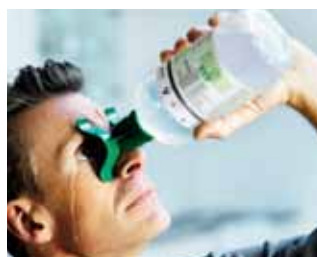
Hajoljon kissé hátra, nyomja össze a flakont, és kezdje meg az öblítést.